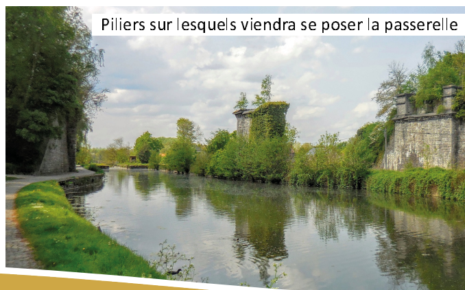
Piliers sur lesquels viendra se poser la passerelle

C'est donc un joli montant qui sera affecté aux divers travaux d'aménagement de la commune à partir de 2018.