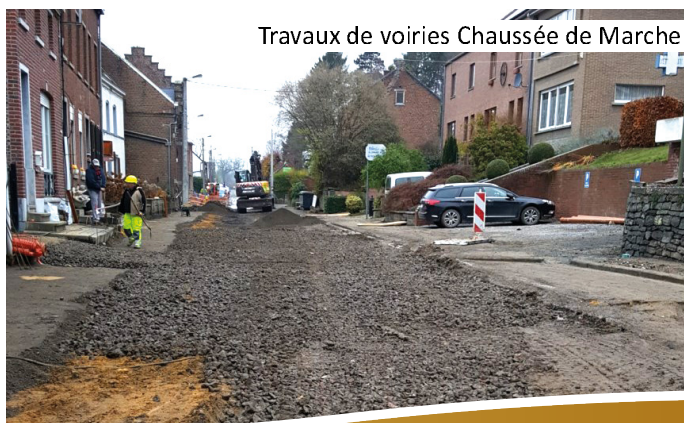
Travaux de voiries Chaussée de Marche